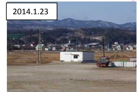
処理完了による仮置場解消事例【岩手県野田村】