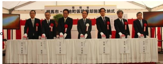
相馬市代行炉火納式(平成26年12月11日)