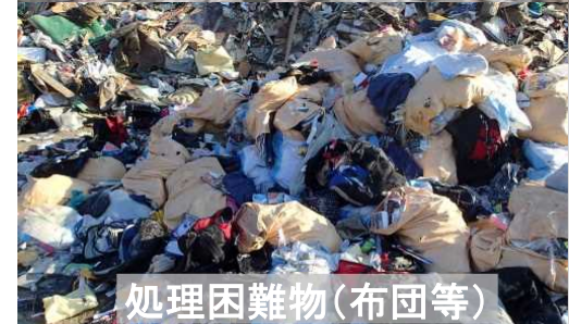
処理困難物(布団等)