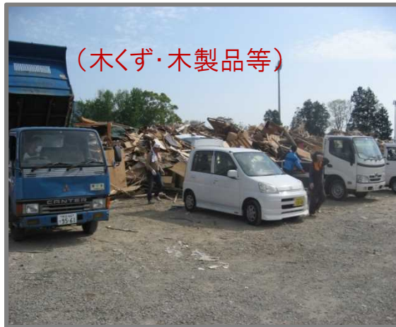
住民による仮置場への搬入状況