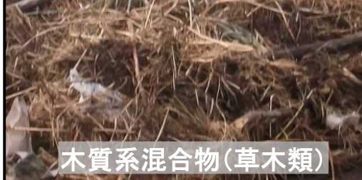
木質系混合物(草木類)