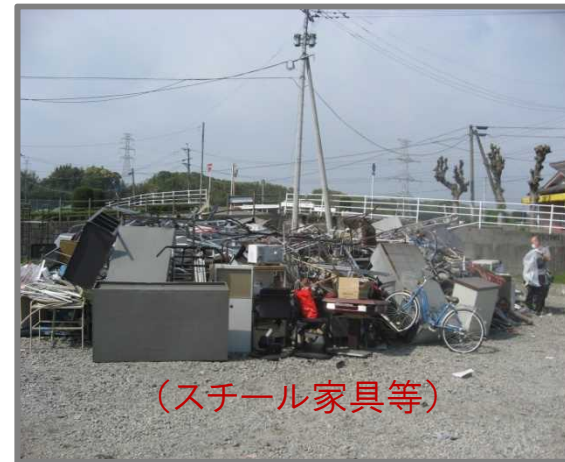
仮置状況(金属製品)