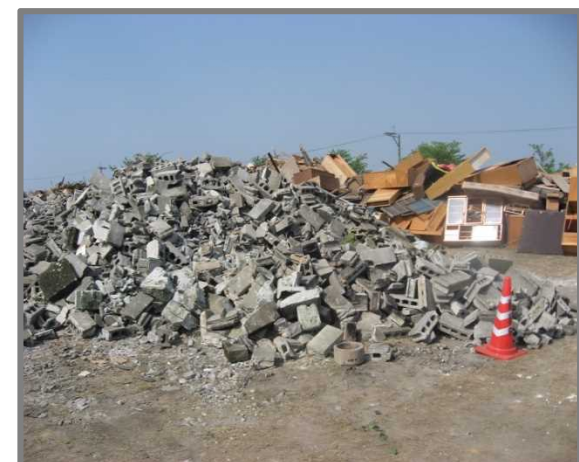
仮置状況(コンクリートブロック)