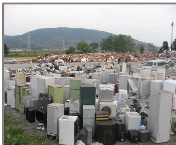
仮置状況(家電4品目)