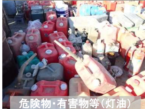
危険物・有害物等(灯油)