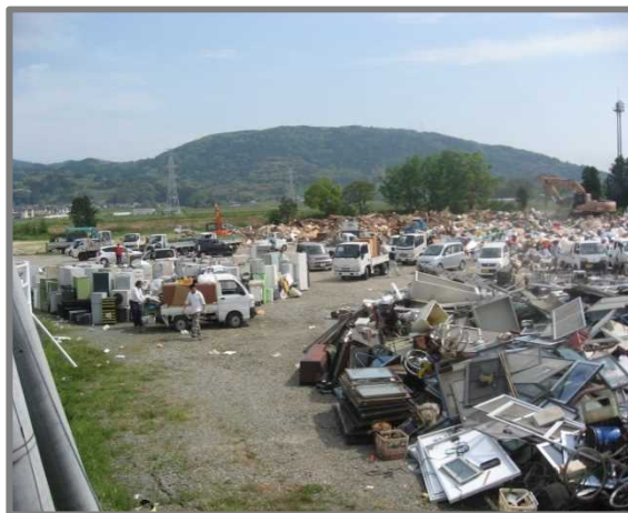
益城町仮置場(全景)