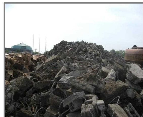
仮置状況(コンクリートブロック)