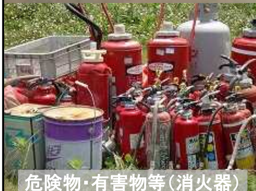
危険物・有害物等(消火器)