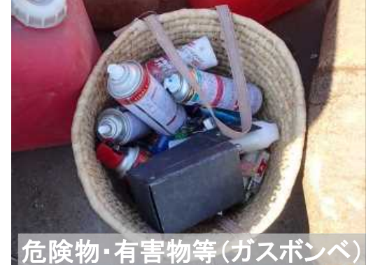
危険物・有害物等(ガスボンベ)