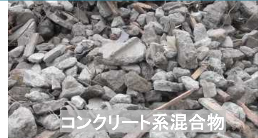
コンクリート系混合物