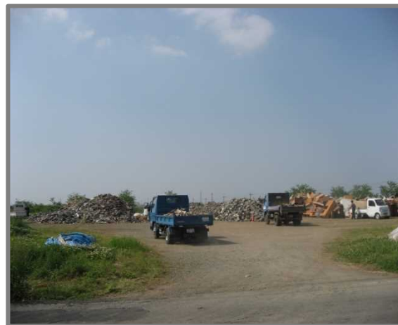
嘉島町仮置場(全景)