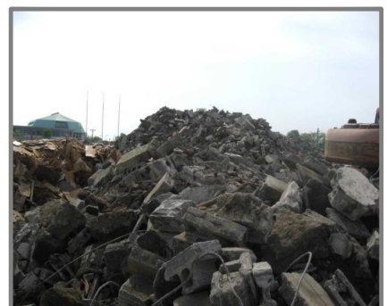
仮置状況(コンクリートブロック)