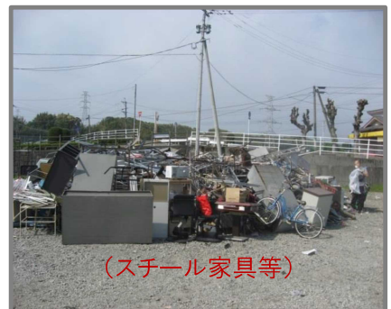
仮置状況(金属製品)