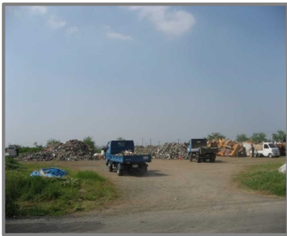
嘉島町仮置場(全景)