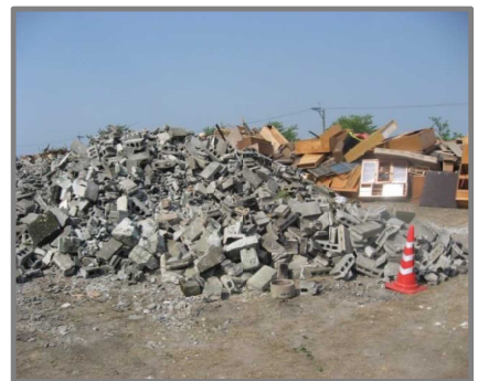
仮置状況(コンクリートブロック)