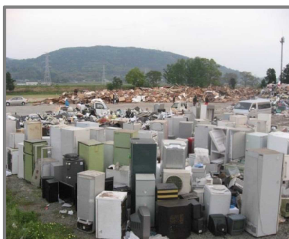
仮置状況(家電4品目)