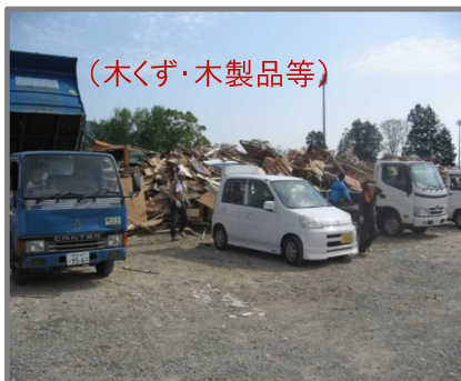
住民による仮置場への搬入状況