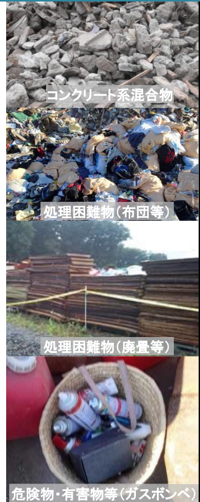
コンクリート系混合物