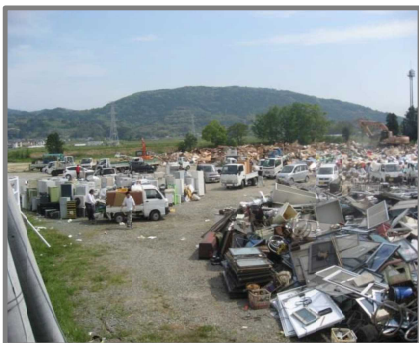
益城町仮置場(全景)