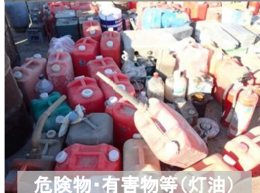
危険物・有害物等(灯油)