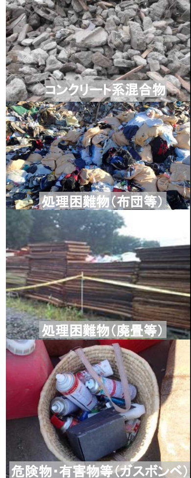
コンクリート系混合物