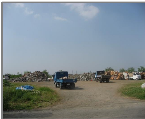
嘉島町仮置場(全景)