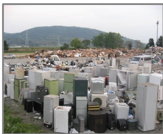
仮置状況(家電4品目)