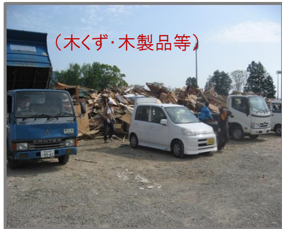
住民による仮置場への搬入状況