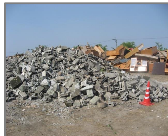
仮置状況(コンクリートブロック)