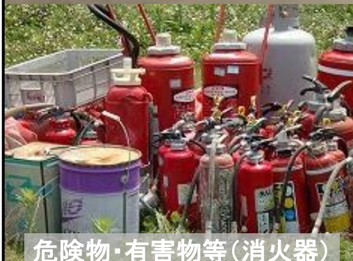
危険物・有害物等(消火器)