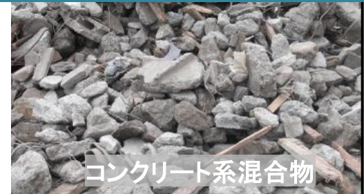
コンクリート系混合物