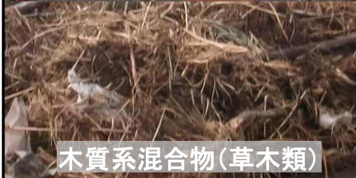
木質系混合物(草木類)