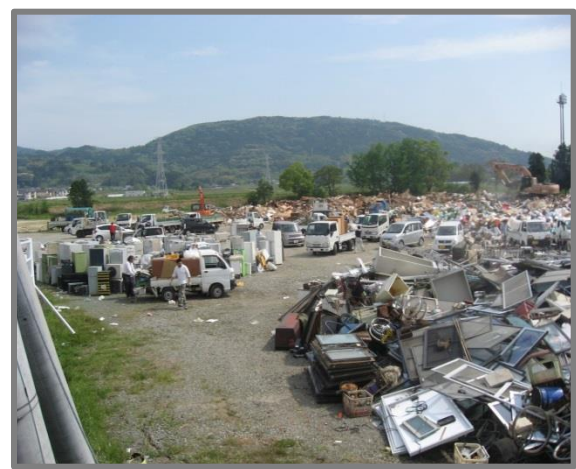
益城町仮置場(全景)