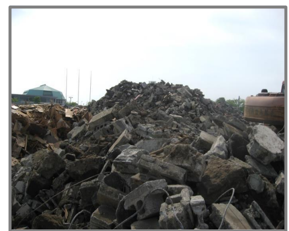
仮置状況(コンクリートブロック)