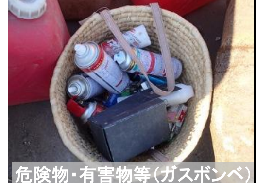
危険物・有害物等(ガスボンベ)