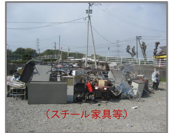
仮置状況(金属製品)