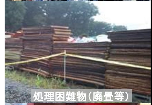
処理困難物(廃畳等)